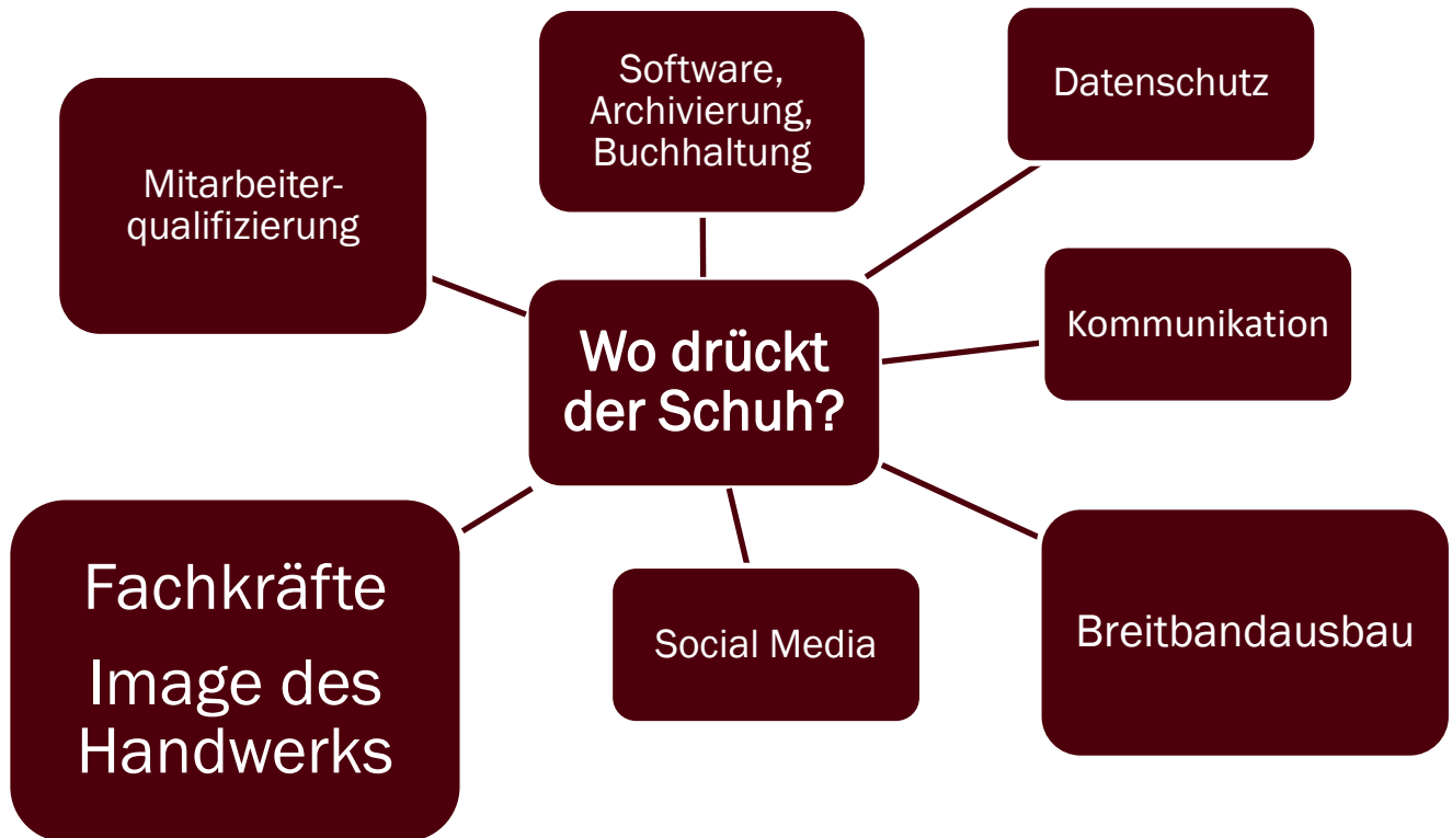
Abbildung 5: Themensammlung der Auftaktveranstaltung

Ihre Beiträge, Anmerkungen und Sorgen lassen sich unter folgenden Stichworten zusammenfassen. Die Größe der Rechtecke weist auf die Häufigkeit der Nennungen hin.