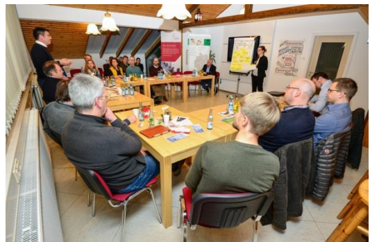
Abbildung 4: Hr. Peggau bringt sich in die Diskussion ein