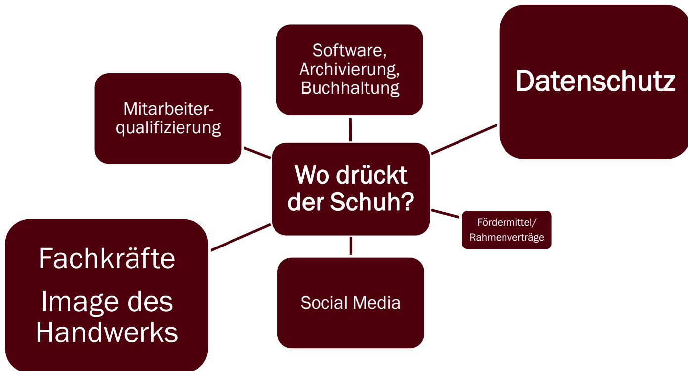
Abbildung 5: Themensammlung der Auftaktveranstaltung

Ihre Beiträge, Anmerkungen und Sorgen lassen sich unter folgenden Stichworten zusammenfassen. Die Größe der Rechtecke weist auf die Häufigkeit der Nennungen hin.