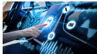
IKT für Elektromobilität