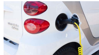
Transport und Logistik