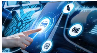
Automatisiertes und vernetztes Fahren